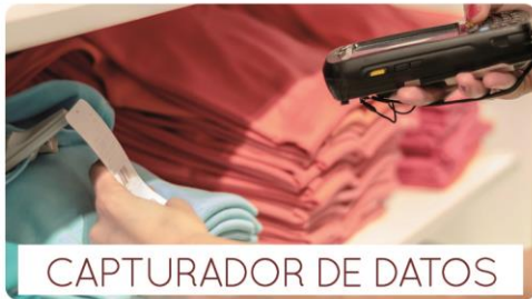
CAPTURADOR DE DATOS