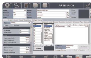
Talla y color