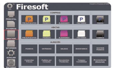
Compras, mayor y almacén