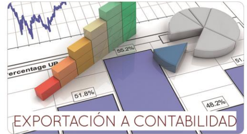
EXPORTACIÓN A CONTABILIDAD