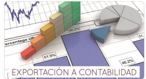
EXPORTACIÓN A CONTABILIDAD