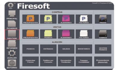
Compras, mayor y almacén