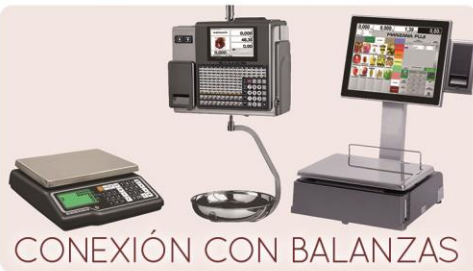
CONEXIÓN CON BALANZAS