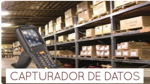
CAPTURADOR DE DATOS